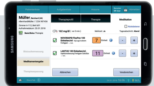
Abb. 2: Dosisberechnung bei der Medikamentengabe durch die Pflege am Tablet